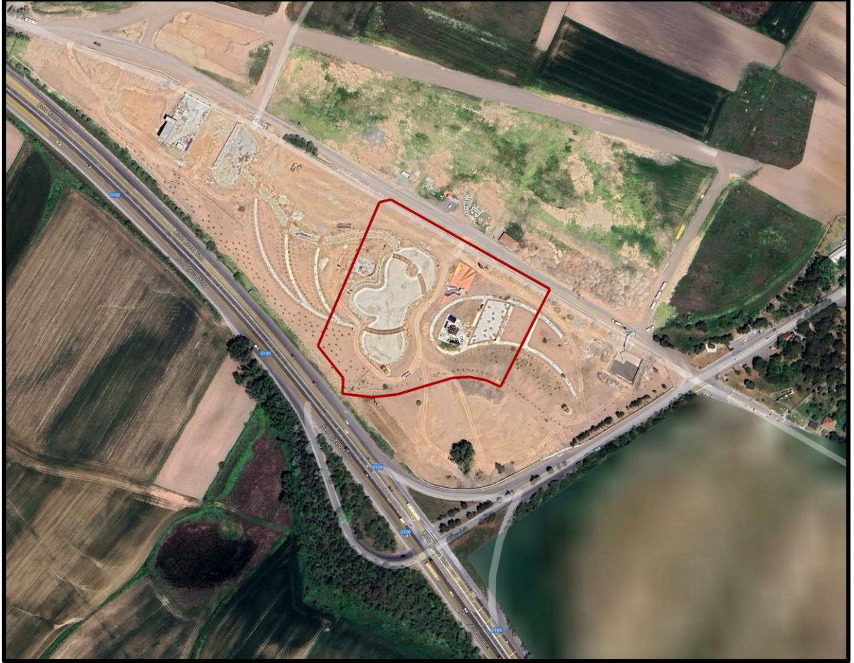
Şekil 1: Planlama Alanın Yeri

Şekil 1’de görülen planlama alanı, F19C13B4B - F19C13B3A nolu paftalarda kalmaktadır.