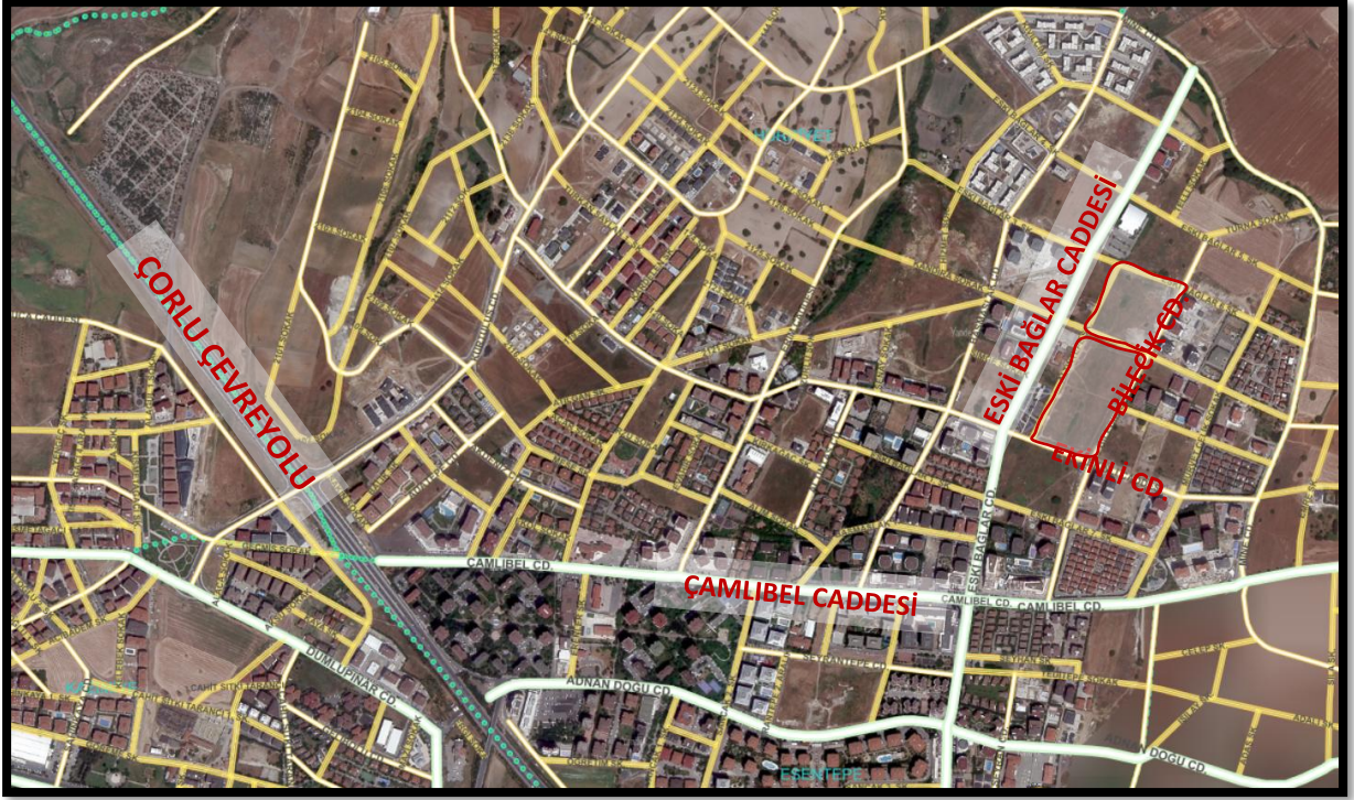
2224 Ada 1 Parsel ile 2231 Ada 1 Parselin Yakın Çevresi Ulaşım Bağlantıları